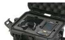
Mousse coupée sur mesure