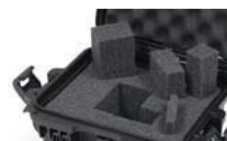
Calages de mousse cubique