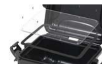
Ensemble de panneau étanche